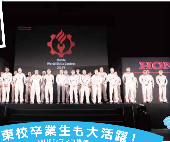
関東校卒業生も大活躍! INパシフィコ横浜