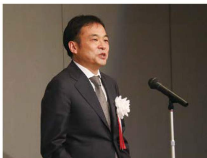
本田技研工業株式会社 寺谷執行役員「式辞」