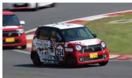
今後の参戦予定レース