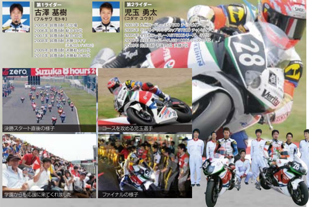
決勝スタート直後の様子

スポンサー並びに関係各位の皆様、ありがとうございました。今後ともよろしくお願いいたします。