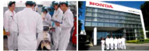
※その他、情報通信研究開発材料でも多数の企業でのインターンシップを実施しています。

大阪発「産学連携コース」とは、専攻の進路を主体的に考え、熱意のある学生のために、大阪府から認定した専門学校が産業界と協力することで学生に就職先などの口は口を開き、教育を提供するもので、全国初の仕組みです。当初は、Hondaの研究開発部門、現在は研究開発のR&Dセンター一階、二階、六階での、業務経験を通して研究開発分野での働くイメージの具体化と、学生生活での様々な自己啓蒙のきっかけとなるようにインターンシップ制度を実施しています。