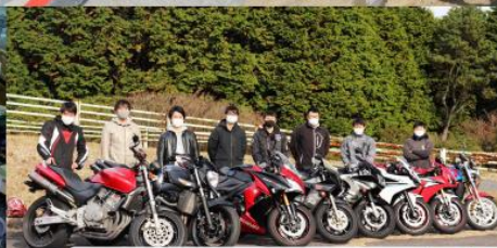
オートバイ同好会