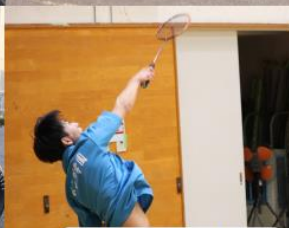
バドミントン同好会