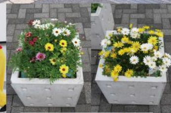
ガーデニング同好会