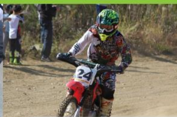
オフロード同好会