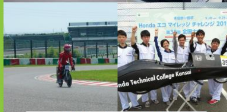
EV同好会 / エコラン同好会